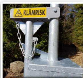
Lyftbom, klar för stängning i upplåst läge.