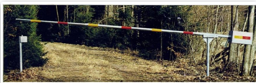
Lyftbom med motviktsbehållare fylld med grus till jämnviktsläge.