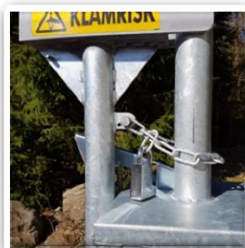
Lyftbom, låst med kätting och hänglås i öppet läge.

Tänk på att aldrig ha fingrarna i klykan där motviktsrör (C) lyfts och sänks mot moderstolpe (A) då det finns en klämrisk här! Använd kättingen för låsning med hänglås av bommen i öppet läge!